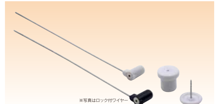
※写真はロック付ワイヤー