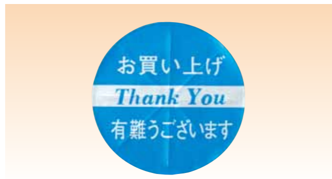
◎ラベルタグの上に重ねて貼り付けることによって、タグの効力を無効にします。 ◎商品をお買い上げいただいたことを示す目印にもなります。