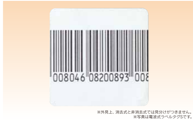
※外見上、消去式と非消去式では見分けがつかずません。 ※写真は電波式ラベルタグSです。

非消去式はレンタル店でのご使用が適しています。当社では全数検査をしておりますので検査に合格した良品だけをお届けします。