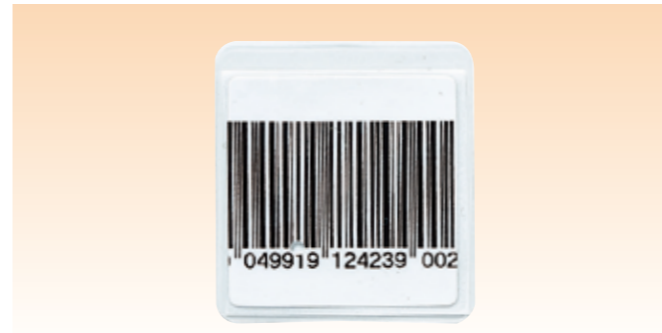
※写真はパウチタグSです。

サイズ:H54×W54 適用ゲート幅:1200~1600mm 受注単位:200枚